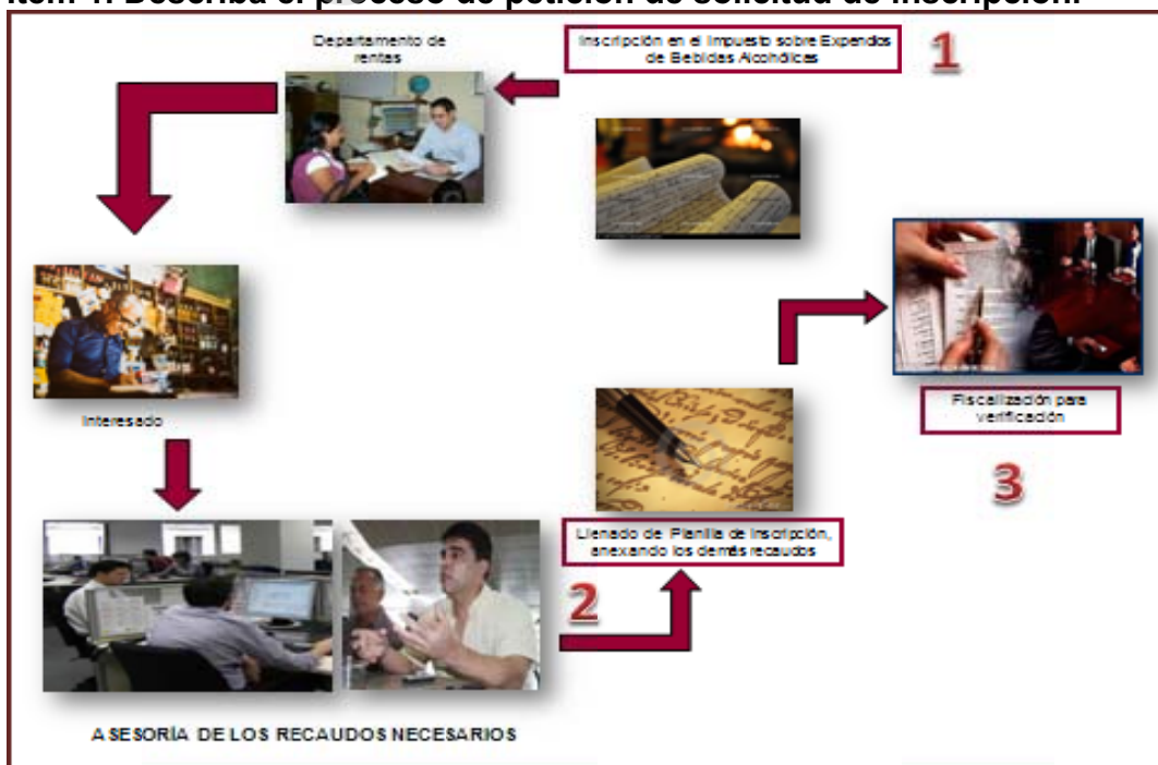
Figura 2. Solicitud de inscripción Ítem 1. Describa el proceso de petición de solicitud de inscripción.