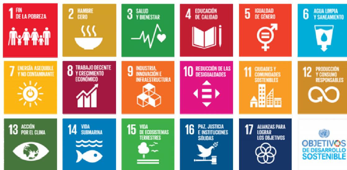
Figura 1. La Agenda 2030 del Desarrollo Sostenible de la Organización de las Naciones Unidas y sus 17 objetivos para el logro del desarrollo sostenible.

Hjorth and Bagheri (2006), sostienen que la ciencia tradicional es incapaz de hacer frente a los problemas de sostenibilidad. Manifiestan que el desarrollo sostenible se ve como un proceso interminable definido por metas y medios específicos que varían en el tiempo para su logro, ya que estos están relacionados con sistemas complejos y auto organizados. Argumentan que, para comprender las fuentes y las soluciones de los problemas modernos, el pensamiento lineal y mecanicista debe dar paso al pensamiento no lineal y orgánico, más comúnmente denominado pensamiento sistémico.