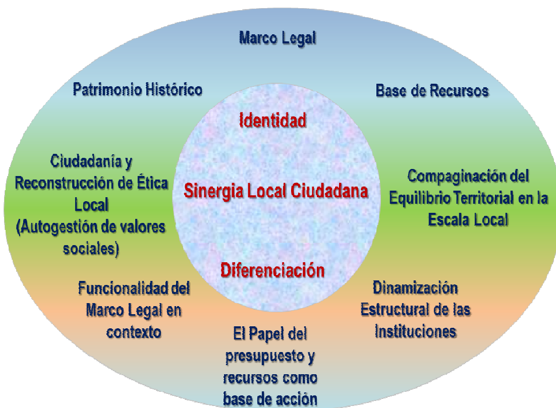
FIGURA 2. Modelo conceptual para la integración de elementos en la dinámica de gestión del desarrollo sostenible en Churuguara, Estado Falcón-Venezuela. Fuente: Elaboración propia.

cambio, debe comenzar por uno de los pilares más sagrados de toda forma civilizatoria: “educar sangre nueva”, para que estas a su vez puedan educar a otras generaciones, y que en cada proceso generacional se profundicen nuevas y mejores versiones del proceso y perspectiva de desarrollo.