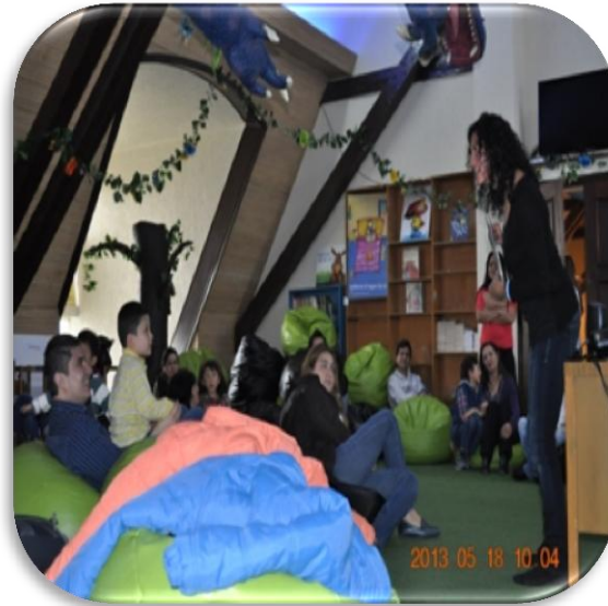
Taller ¿Cómo leer en familia?