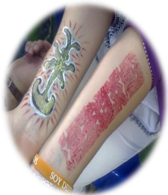
Taller de maquillaje precolombino: Música, arte y literatura