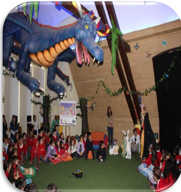
Presentación del poemario “La casa de la playa”