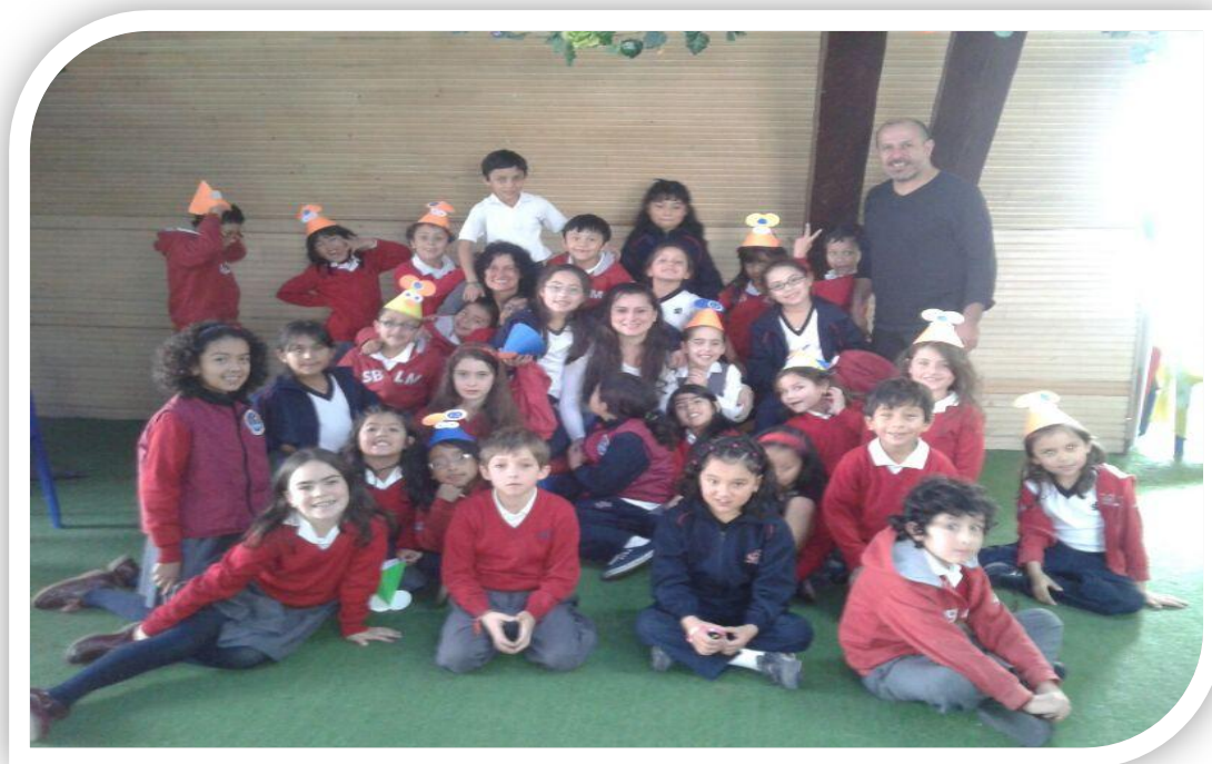
Club de amigos: "Soñando en la Biblioteca"