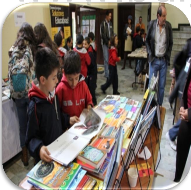
Feria del libro San Bartolo Lee