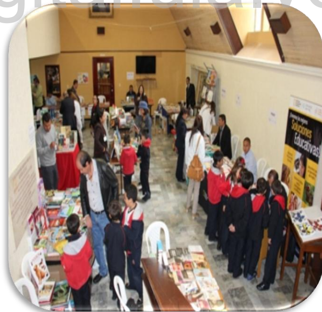
Feria del libro San Bartolo Lee