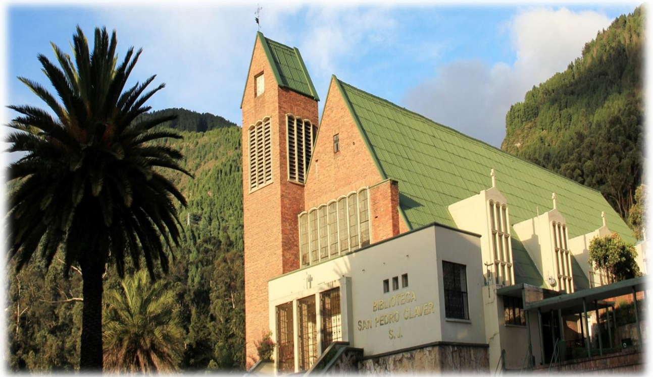
Biblioteca San Pedro Claver, S.J.