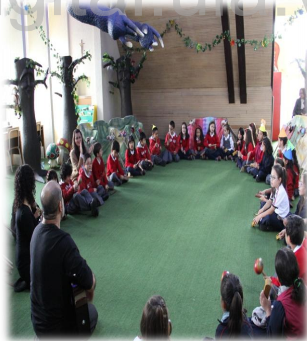
Actividad de clausura: “En el país de Tongopolis”