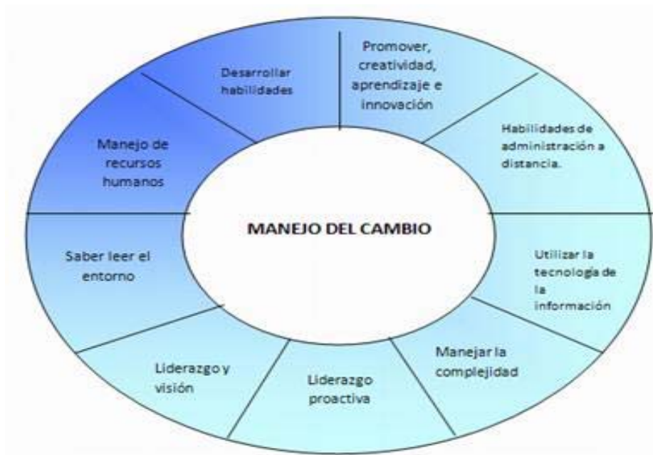
Figura 3. Manejo Del Cambio