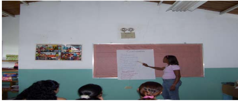
Fotografía N° 4

Dinámica denominada mapa mental o mapa del tesoro, donde a través de imágenes, dibujos o recortes, los docentes plasmaron sus estilos de liderazgo, considerando los tipos de la personalidad.