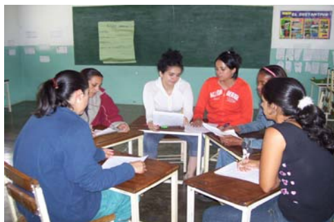
Los docentes se muestran motivados para la participación.

En cuanto a la integración a las actividades desarrolladas en el taller, se evidenció que un 20% de ellos fueron proactivos y asertivos en el desarrollo del taller, con disposición para el trabajo. El resto de docentes, es decir un 80% hubo que motivarlo para su integración. Así mismo, se evidenció que existe necesidad de motivación y estímulo para desarrollar efectivamente la actividad.