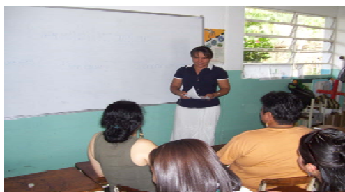
Fotografía N° 1

La facilitadora al momento de hablar sobre la sensibilización y motivación al logro.