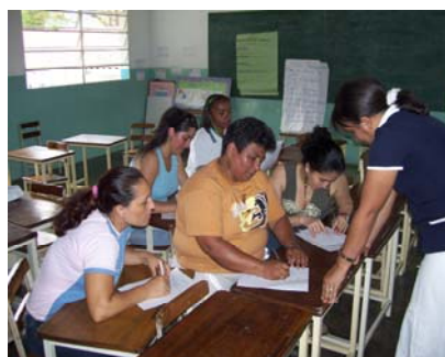
La facilitadora escuchando las experiencias y relatos de los participantes.

En conclusión, los/las docentes manifestaron apertura hacia el cambio, es decir, quedaron comprometidos/as en asumir cambios y nuevos paradigmas educativos en