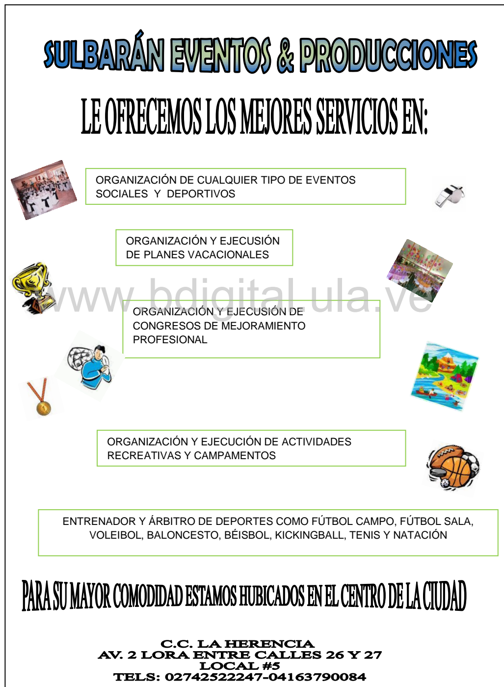
Gráfico N° 6. Volante de la empresa