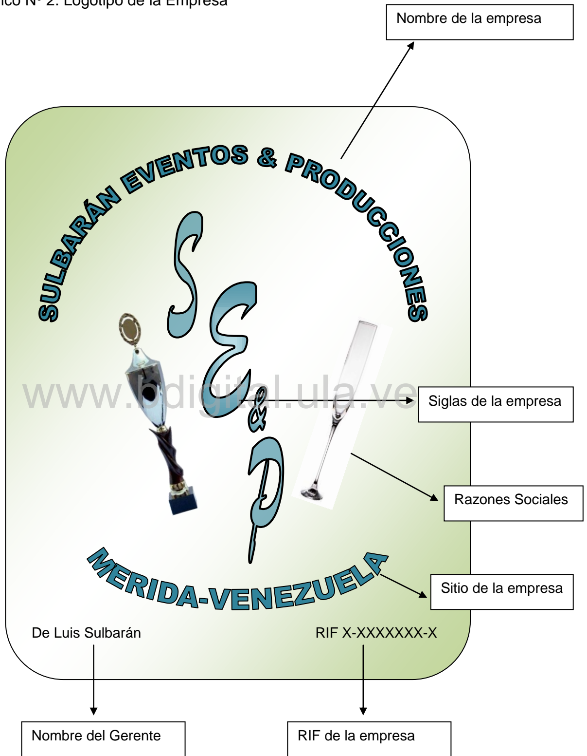
Gráfico N° 2. Logotipo de la Empresa