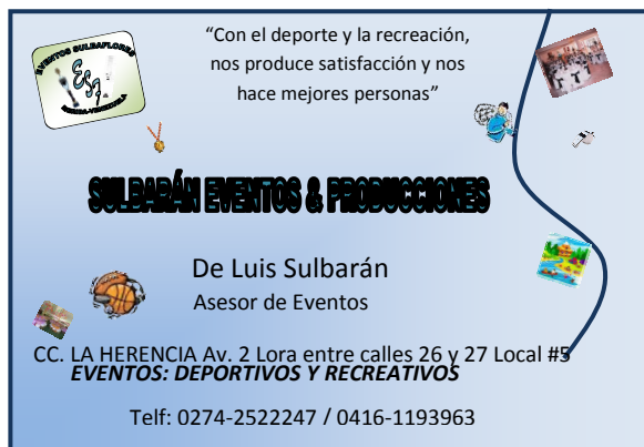
Gráfico N° 4. Siglas de la empresa