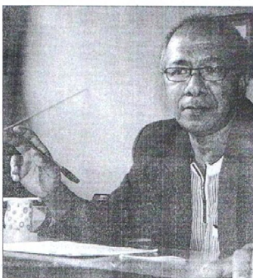
Los latinoamericanos tenemos una estructura gramatical que se diferencia a la del español peninsular.

"Buena parte de mi comportamiento es producto de la enseñanza de su "familia chiquita, de mamá, papá y papaviejo. Mis padres,