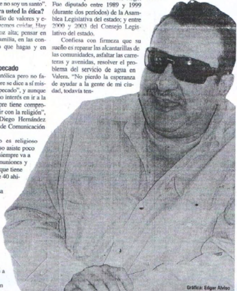
Gráfica: Edgar Alviso

«Precisamente sobó anoche que le escribiría una carta en la que le hacía un análisis de su gestión y le pedía que rectificara. Él me contestó que tomaría cuatro medidas: Liberaría a los presos políticos, devolvería la señal abierta a Rtv, cesaría su deseo de expropiar y se pondría de acuerdo con los empresarios privados (...) Pero claro, fue sólo un sueño».