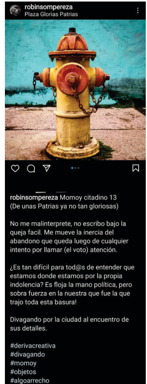
Robinson Pérez Momoy ciudadano 13 / 2021