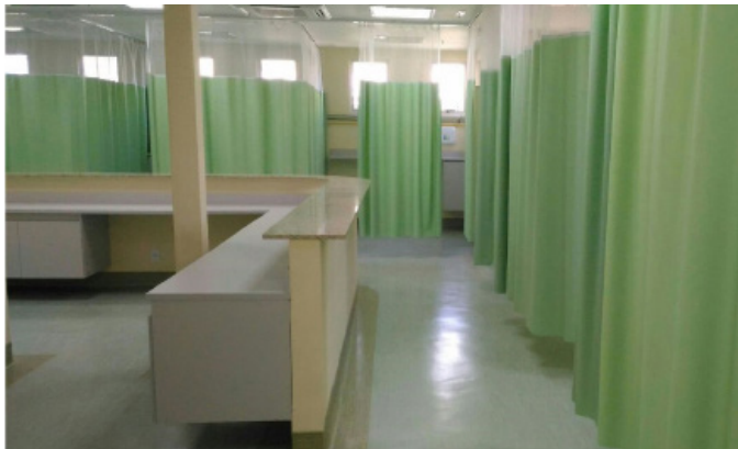
Sala de observación masculina