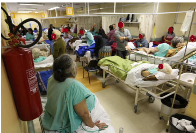
Lámina 2. Ejemplos de invasión del espacio personal de los pacientes en entornos sanitarios “superlotação”