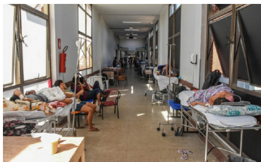
Lámina 4. Pacientes hospitalizados en áreas inadecuadas

Fuente: https://s.afnoticias.com.br/cache/2023/0911803867e99a36e9f0373a3d7d96e6.jpg