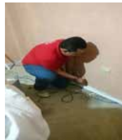
Figura 3. Ubicación de canaletas y equipos de red