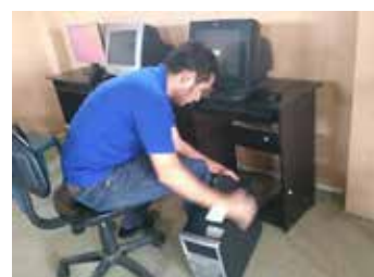
Figura 4. Ubicación equipos de red en red