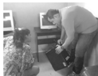
Figura 7. Explicación sobre correcto soporte a usuarios

En dicha capacitación se le dio a conocer las recomendaciones para mejorar la vida útil de cada uno de los equipos, además se les explicaron los problemas básicos que pueden presentarse cuando los computadores no enciendan (Figura 7), también se explicó cómo poner un disco duro y como verificar el funcionamiento correcto de memorias, RAM entre otros.