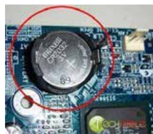
Figura 1. Batería de Mainboard

arreglar o repararlo que está en mal estado en la infraestructura tecnológica. Primeramente, se consideraron los 4 equipos que presentaban problemas de lentitud, algunos de ellos no prendían correctamente y otros presentaban inconvenientes con la batería del mainboard, lo cual hacía un poco lento el proceso de encendido del computador. Se procedió a cambiar las baterías de los mismos, la cual se muestra en la Figura 1, para evitar el error de pantalla causado por el agotamiento de las mismas. Este error es incómodo para los usuarios ya que al aparecer al iniciar el computador dan a entender que el computador no enciende o tiene algún tipo de daño porque no carga directo el logo, sino que toca en mucho de los casos presionar la tecla F1. Se pudieron agregar 3 equipos más a los 4 ya existentes en dicha área, cabe indicar que los computadores fueron entregados con mouse, teclado y parlantes para ser ubicados dentro del cyber de Puerto Engabao.