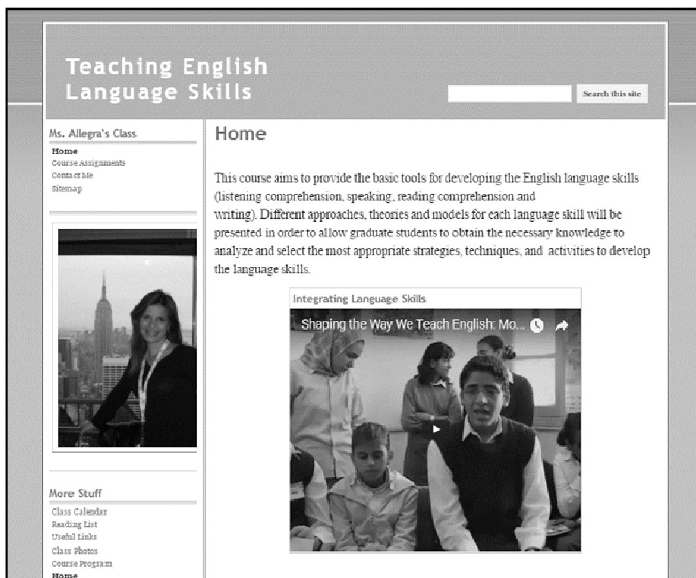
Figura 1. Página Principal de la Wiki

Este wiki incluye la página de inicio donde se establece el objetivo del curso. Además de la barra de navegación de la izquierda, incluye enlaces a las asignaciones del curso. La barra de navegación también proporciona enlaces hacia la información de contacto y el mapa del sitio del wiki. Además, la barra de navegación debajo de la fotografía de la profesora en el wiki ofrece a los estudiantes enlaces a un calendario de clase, una lista de lecturas con la bibliografía de las clases y otros sitios útiles.