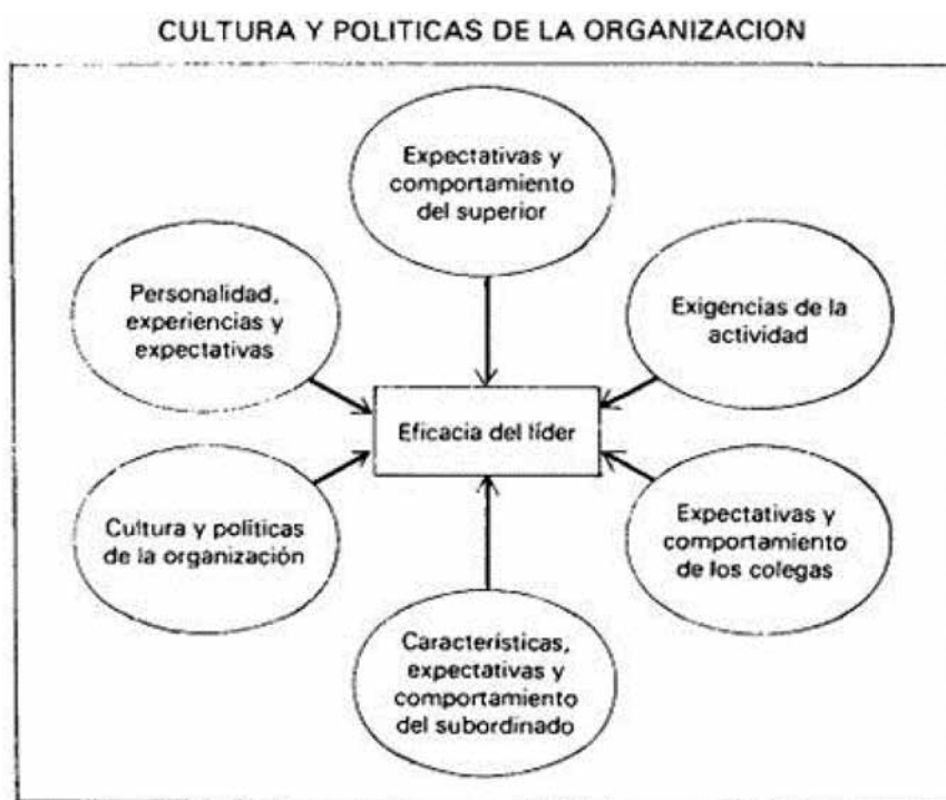
Figura 3. Factores de personalidad y situaciones que influyen en un buen Liderazgo.

Resumiendo, entonces, las peculiaridades de un líder están centradas en gran medida en ser un jefe con habilidades y conocimientos desarrollados altamente, debe tener un carácter de miembro de un grupo en el que compartirá sus costumbres, ideas y sueños, es un visionario de principios claros de mente abierta y resuelto para el cambio, con proyectos revolucionarios e intrépidos antes las posibilidades de desarrollo de la empresa.