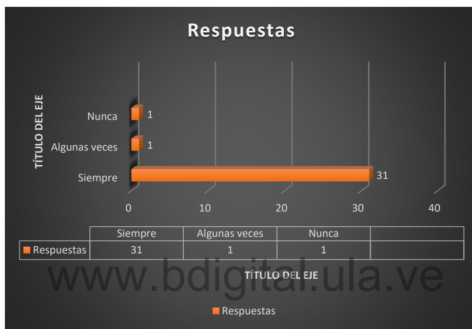
Gráfico N° 18

En esta grafica se muestra como el 97% de los encuestados le gustaría recibir información académica sobre emprendimientos, mostrando así el interés y necesidad de que exista programas de formación a los cuales ellos puedan acceder para capacitarse.