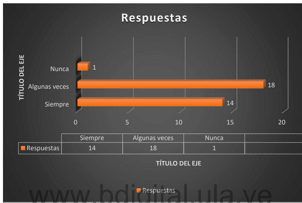
Gráfico N° 6

El 55% de las personas dice tener capacidad para resolver problemas, el 42 % dice tener alguna capacidad, mientras que solo el 3% expresa no tener ninguna capacidad