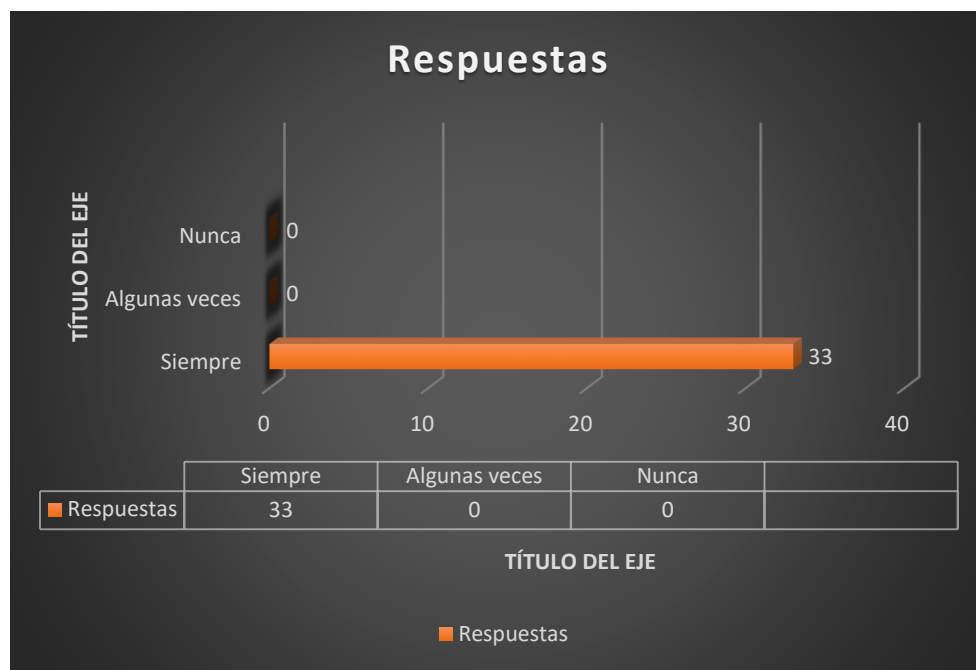
Gráfico N° 12