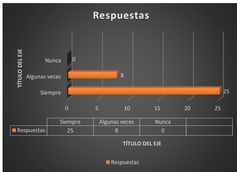
Gráfico N° 8