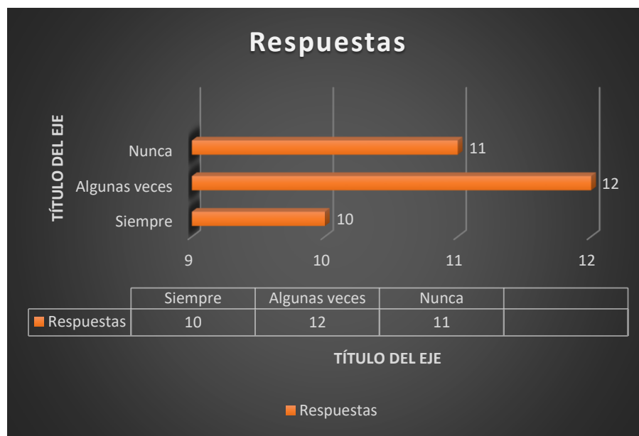
Gráfico N° 11

En esta grafica podemos deducir que solo el 30% de los encuestados cree que existen oportunidades de negocio en su comunidad, mientras que el 70% piensa que hay pocas o ninguna oportunidad de negocio, esto puede deberse a varios factores entre ellos, la falta de información para emprender, la desmotivación o desaliento, la propia crisis económica, la idea de depender de una beca o trabajo por parte del estado, entre otras causas.