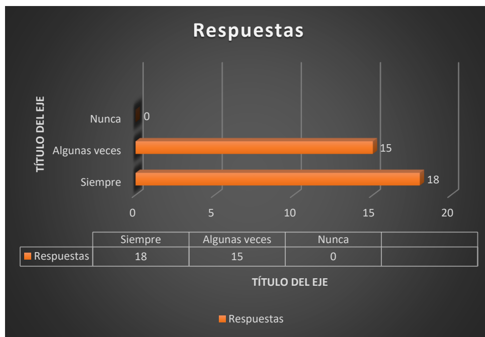
Gráfico N° 15