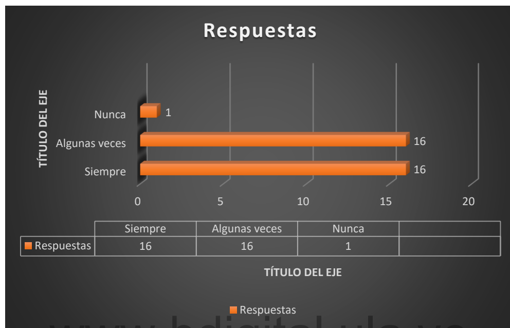
Gráfico N° 5

Cuando se les pregunto si han tenido alguna experiencia donde pongan en práctica sus cualidades de líder el 97 % expreso que siempre o algunas veces lo ha hecho, mientras solo un 3% dice que no. El liderazgo en los emprendimientos se define como la habilidad de guiar e influir positivamente en un equipo, creando un ambiente propicio para el éxito. Un líder emprendedor efectivo motiva y dirige al equipo hacia un objetivo común, asumiendo una responsabilidad social hacia clientes, la comunidad y la organización. El liderazgo emprendedor es esencial para el crecimiento y la sostenibilidad de cualquier emprendimiento. Implica inspirar, comunicar eficazmente y tomar decisiones estratégicas para alcanzar el éxito.