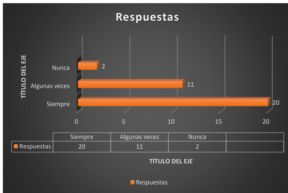
Gráfico N° 7