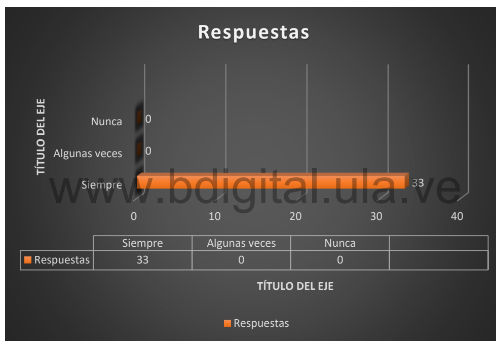
Gráfico N° 17

El 100% de los consultados quiere tener herramientas de aprendizaje que le permitan desarrollar sus ideas de emprendimiento sostenible, para mejorar su situación económica.