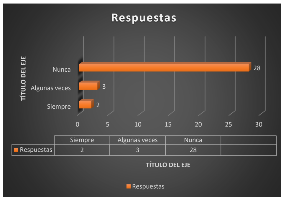
Gráfico N° 16