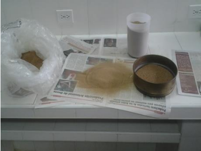
Fig. 1.- Preparación de la harina