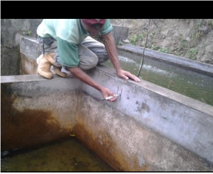
Fig. 5.- Preparación de los tanques para la siembra de los alevines