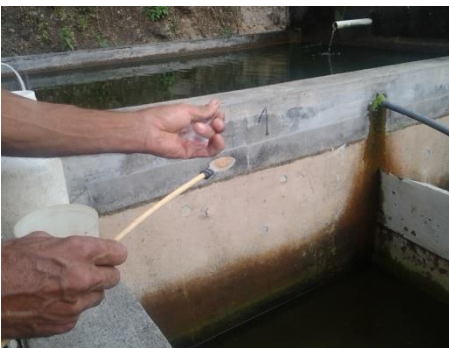
Fig. 11.- Aplicación de las dietas