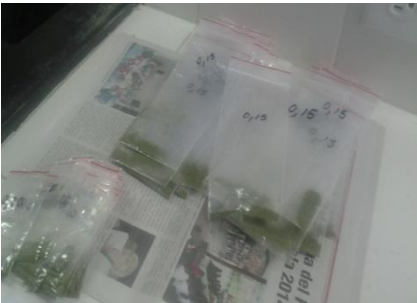
Fig. 3.-Pesaje de las harinas