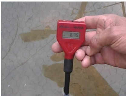
Fig. 7.- Medición del pH