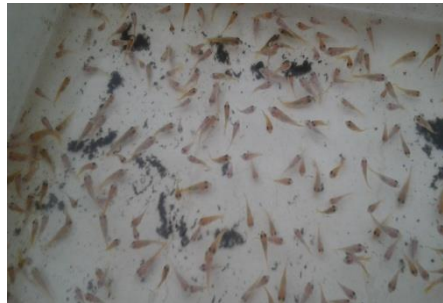
Fig. 4.- Llegada de los alevines a la granja