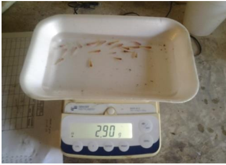
Fig. 9.- Pesaje inicial del 20% de los alevines