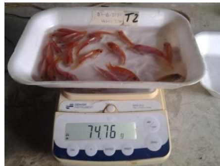
Fig. 12.- 2do pesaje del tanque 2