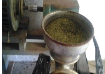
Fig. 2.- Molienda de hojas de morera