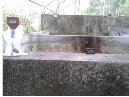
Fig. 6.- Medición de la temperatura de los en los tanques