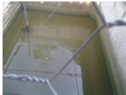
Fig. 8.- Siembra de los alevines