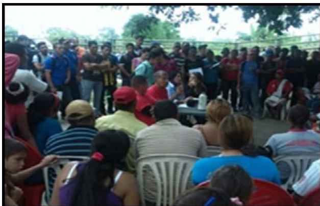
Figura 5. Encuentro con líderes de la comunidad