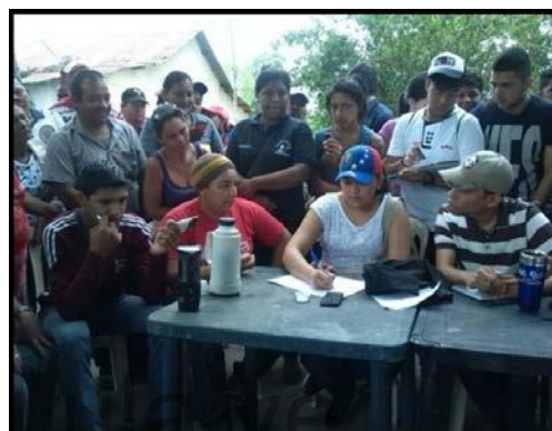
Figura 4. Abordaje comunitario

concreción de soluciones a estas deficiencias en su ámbito rural y que les permitan la optimización del desarrollo rural en la zona. Particularmente, el diagnóstico participativo y las conversaciones con la comunidad permitió determinar el origen y estado actual del asentamiento, caracterización del área de estudio, elementos físicos-naturales y geográficos, la población que la conforman, las características relevantes, las características y condiciones socioeconómicas del asentamiento, así como también condiciones educacionales, culturales, de infraestructura y vialidad. (Ver figuras del 4 al 6)