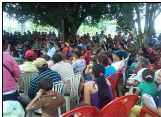
Figura 6. Diagnostico participativo