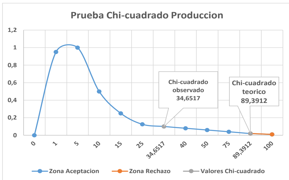
Figura 1. Chi-cuadrado, prueba bondad de ajuste. Variable Producción