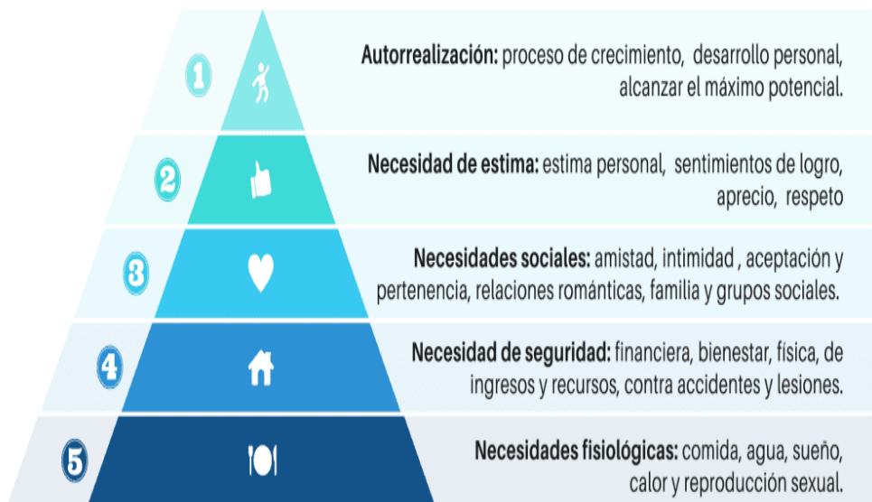
Figura 4. Pirámide de las Necesidades.