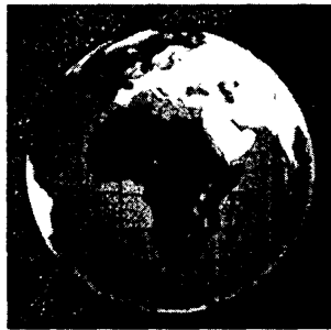
ÁFRICA EN EL MUNDO

En el siguiente dibujo verán a África de color rojo.