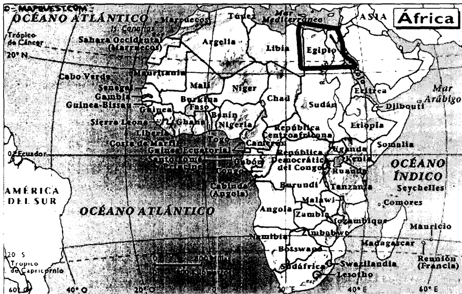
MAPA DE ÁFRICA

A pesar de la corrección hecha, aun faltaría incluir un ejercicio en los que se relacione el lugar que se quiere ubicar en el mapa con el país, región, continente, donde vive el niño.