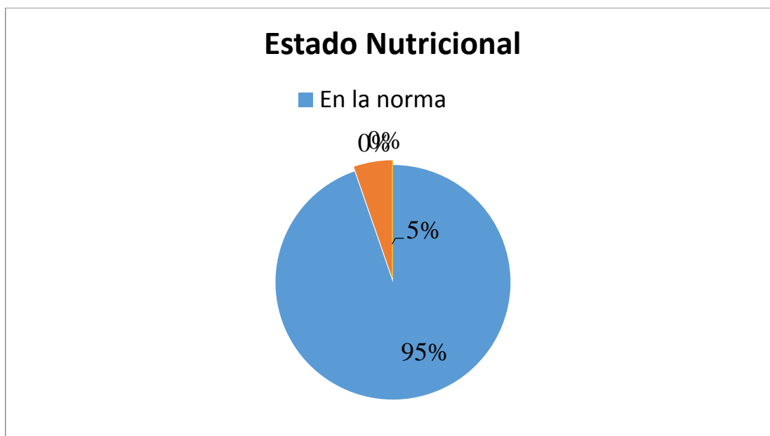
Grafico 1. Estado nutricional de los jugadores de futbol de campo atlético “El Vigía”.