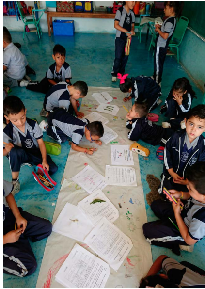
Taller de museos escolares: Elaboración de materiales para exposición.