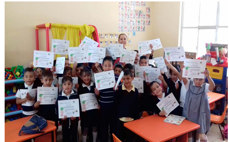
Grupo de trabajo con reconocimiento del proyecto.