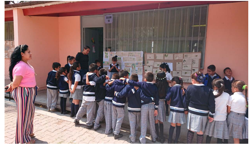
Explicación de Museo escolar.