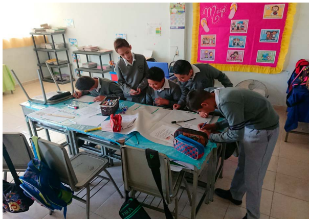
Taller Museo escolares: Elaboración de materiales para exposición.