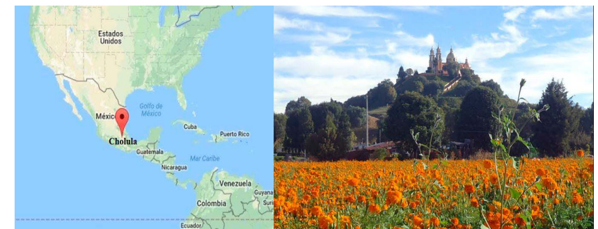
Foto 1. Ubicación geográfica de Cholula y vista sur de la Gran Pirámide coronada por la iglesia de la Virgen de los Remedios.

ción de Cholula de 1581, habla de la multitud de ermitas donde se adoraban diferentes ídolos, destacando un “cerro grande” dedicado a Chiconahuiquiauitl “dios del agua o el que llueve mucho” (De la Maza, 1959: 20-23). Con el fin de erradicar los cultos paganos que seguían realizándose en la cima de la pirámide, los franciscanos reemplazaron a las deidades mesoamericanas por católicas. En 1594 se construyó una ermita dedicada a la Virgen de los Remedios que se fue ampliando y adornando, hasta sufrir los estragos de un terremoto en 1864, por lo que volvió a erigirse conservando su estructura y disposición original, pero con una ornamentación neoclásica (De la Maza, 1959: 102). Esta importancia religiosa trascendió durante la época colonial y se ha mantenido hasta la actualidad, siendo Cholula un importante centro religioso y comercial.