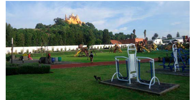
Foto 3. Área de juegos infantiles y gimnasio del Parque Intermunicipal, vista sureste.

Este clima agitado no impidió las obras del Parque Intermunicipal que, aunque de manera atropellada y con interrupciones, se llevaron a cabo y no sólo modificaron el paisaje inmediato del cerrito, sino que fueron el preámbulo a la fuerte actividad constructiva que hasta la fecha sigue transformando a la ciudad (Foto 3). El 17 de enero de 2017, el movimiento “Cholula Viva y Digna” denunció el incumplimiento de los acuerdos a los que habían llegado con el ayuntamiento de San Pedro Cholula con respecto a las obras en el Parque Soria, el Recinto Ferial Xelhua y las calles aledañas, reprochando el adoquinamiento de veredas alrededor de la pirámide y de los campos de flor, la tala de árboles, el uso de concreto y la remoción de los artesanos para la realización de obras constructivas (Mastretta, 2017).