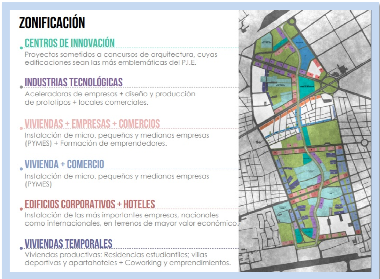
Figura 2. Zonificación propuesta → Polígono de innovación y emprendimiento de Barquisimeto