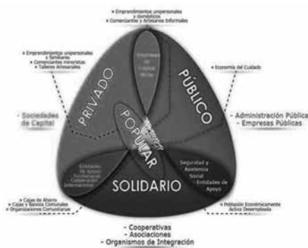
Figura 2. Sectores económicos en Ecuador