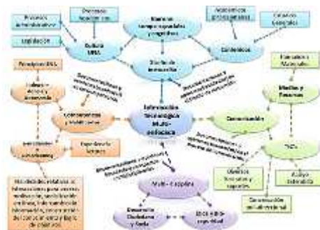
Figura 2. Trama de Interacciones Tecnológicas Multi-enfocada, emergente de la triangulación hermenéutica.

En la figura 2, se muestra gráficamente la trama de interacciones tecnológicas, desde una perspectiva multi-enfocada y multi-intencionada que surgió del proceso de triangulación hermenéutica.