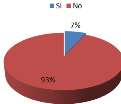
Gráfico N° 1 ¿ Conoce usted el número telefónico del cuerpo de bomberos de su zona?