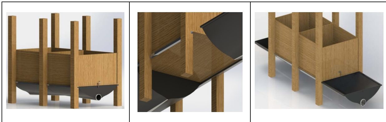
Figura 1. Embudo para aprovechamiento máximo del mucilago. (Instalado en la parte baja del cajón de fermentación).