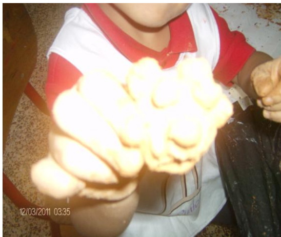
El oso frontino