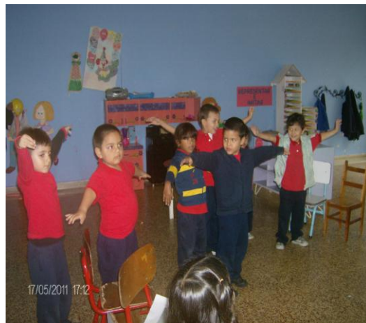
Las águilas del mito.