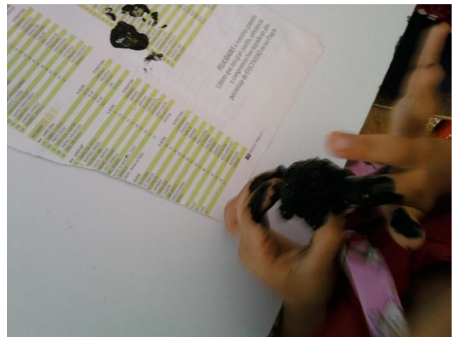
Pintando el oso frontino.