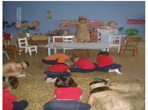
Dramatización y adoración de la Diosa Ikake