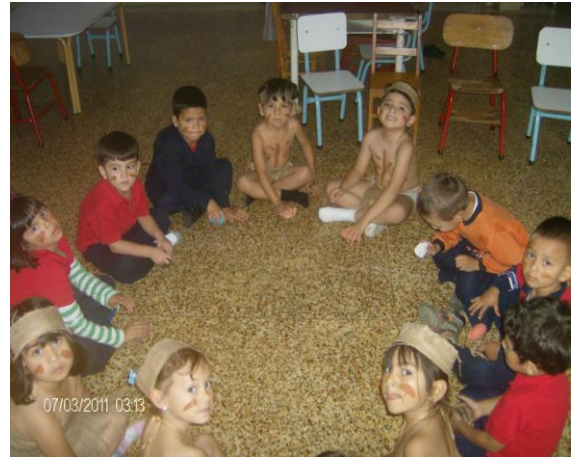
Las piedras sagradas