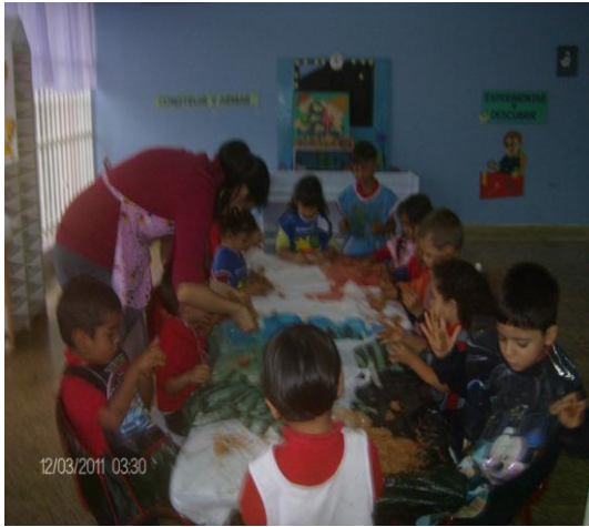
Comienzo de la actividad