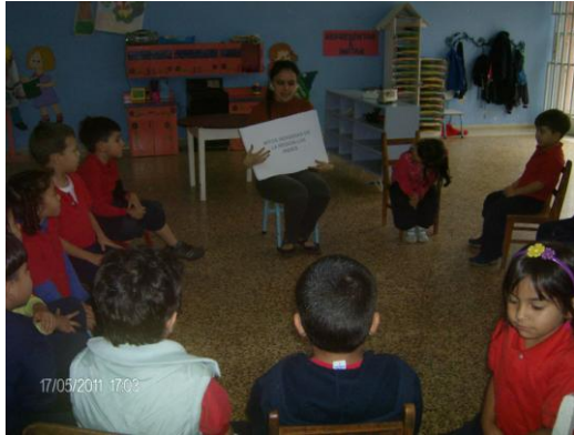
Comienzo de la lectura.