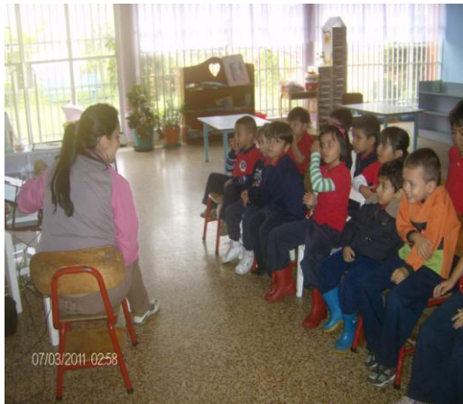
Presentación de las diapositivas. indígenas.