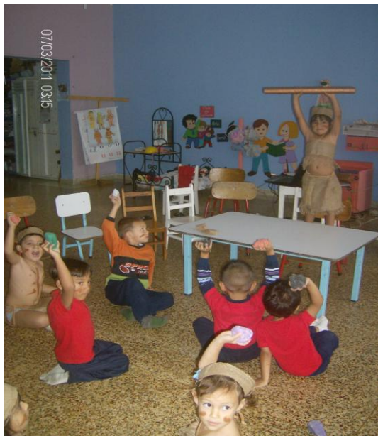
Rito de protección de las piedras