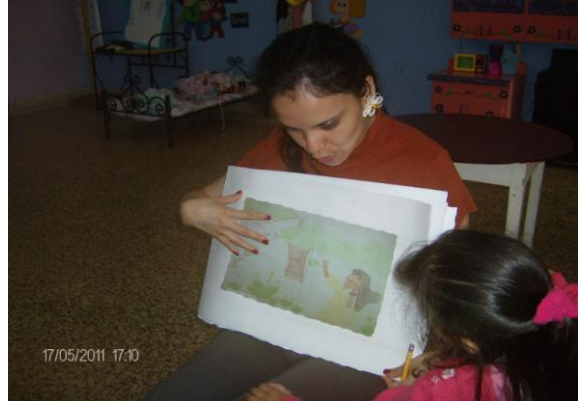
Dramatizando el mito.