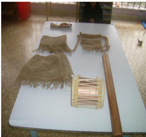
Vestuario e instrumentos musicales.