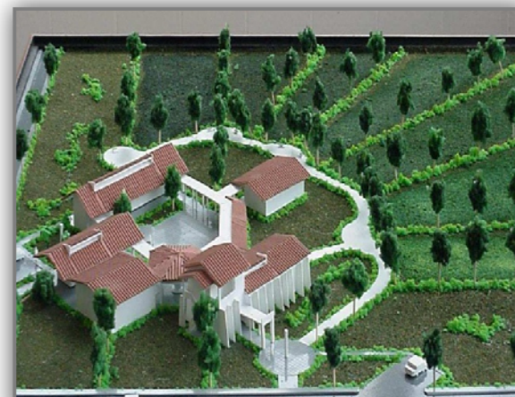
Ilustración 5: Maqueta de Proyecto

El proyecto consta de 2 módulos básicos: uno contentivo de dos aulas para usos múltiples y el otro destinado para el área asistencial, además de baños públicos y dos habitaciones para alojamiento de las personas que asistieran a cumplir labores en el centro comunitario.