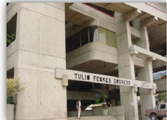
Ilustración 8: Fachada Principal

Es el principal centro cultural de la ciudad, fue construido por el Arq. Iván Castellanos e inaugurado el 21 de diciembre de 1994, en el terreno donde funcionaba el antiguo Mercado Principal. Este edificio de arquitectura moderna abarca un área de 16.000 mts 2 , y aloja salas de exposiciones,