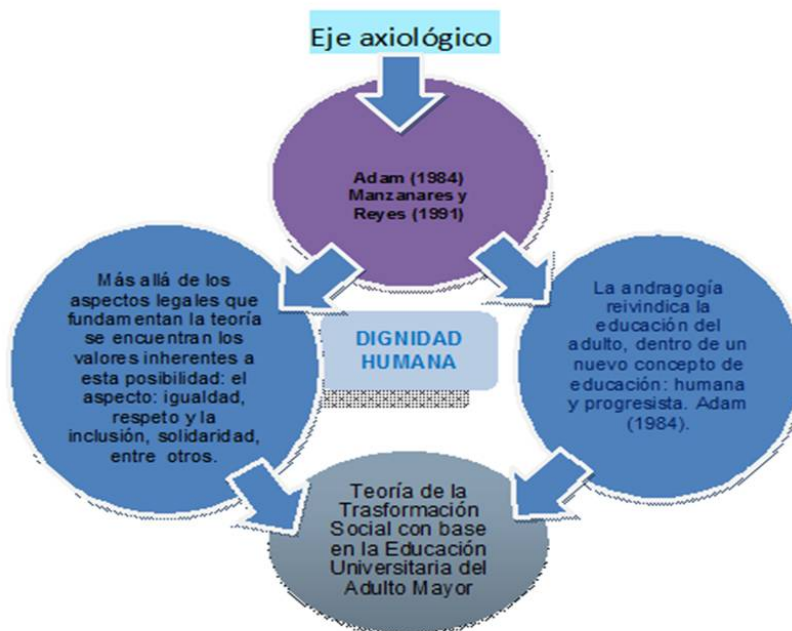
Fig.N.4 Identificación de constructos del eje axiológico.

(2005), y Adam (1984). Estableciendo relación con la contribución que todo ese conocimiento hace a la teoría planteada ( Trasformación social con base en la edu-