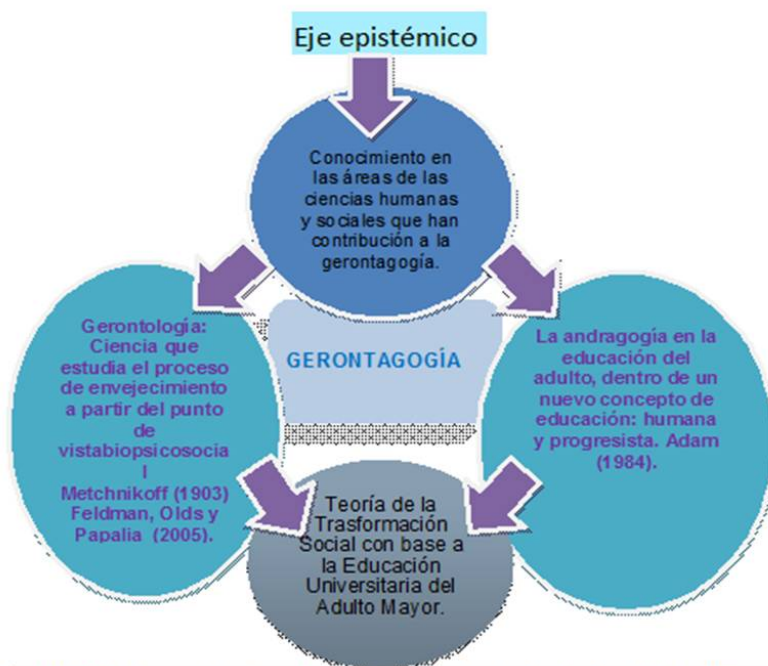
Fig. N°3. Identificación del eje epistémico de la teoría.

En este sentido se cita a dos autores clásicos Vigotsky (1979) y a Burk (1985), quienes señalan: el primero la relación del individuo con el entorno como una diada indivisible de retroalimentación permanente; el segundo autor puntualiza la interpretación que hace el hombre de ese medio (el cual intenta comprender) en busca de satisfacer sus necesidades; incluso más allá en la edad adulta mayor.