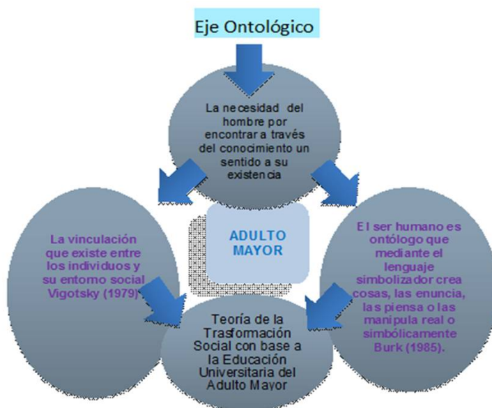
Figura N° 2 Identificación del eje ontológico de la teoría.

Al intervenir el texto del cuerpo del postulado teórico de manera analítica, se pueden destacar las palabras clave y planteamientos e identificar las premisas y los ejes ontológico, epistemológico, axiológico y metodológico que fundamentan la teoría. Se resalta de manera subrayada la premisa nudo o esencia. Pero antes se recomienda ver una serie de figuras que ilustran los referidos ejes y finalmente la representación gráfica de la Teoría de la transformación social con base en la educación universitaria del adulto mayor .