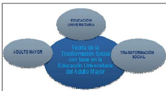
Figura N°.1 Identificación de constructos de la teoría. Fuente:Revilla, E y Gil, R. (2013).

En este orden de ideas, cada constructo permitió durante el desarrollo de la fundamentación y postulado, identificar a su vez, las premisas teóricas y la relación e integración que ofrece la coherencia interna de la teoría. Planteamiento teórico en el cual resalta la figura del adulto mayor como actor principal, quien encontrará en la educación universitaria una opción, para lograr coadyuvar a la transformación social a intervenir a partir de sus habilidades motoras y cognitivas de reserva ante el contexto socioeducativo venezolano. Experiencia académica innovadora que ha de considerar la realidad biopsicosocial de este grupo etario, tal y como se explica en la Figura N°1.