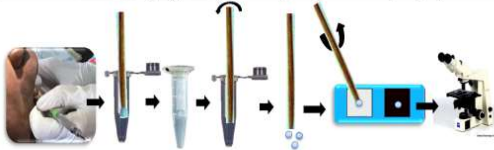
Figura 1. Proceso de toma de muestra, transporte y análisis.