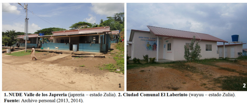
Figura 2. Proyectos de vivienda indígena para el desarrollo endógeno.

y el abandono institucional en materia de producción y seguridad.