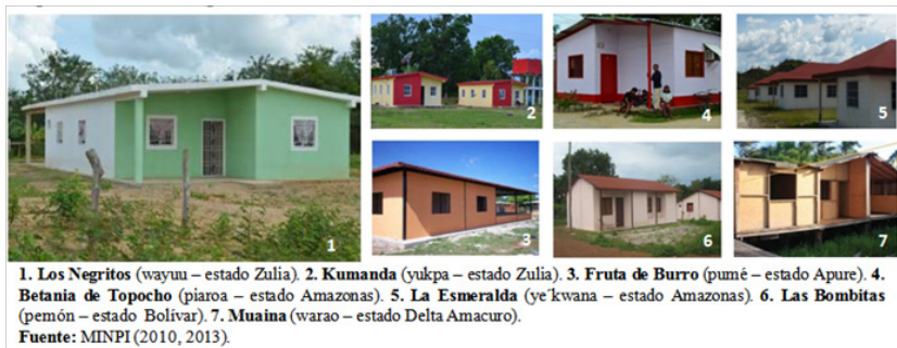
Figura 3. Comunas Indígenas Socialistas del Minpi.

A pesar de esto, con estos ensayos en siete comunidades se había enunciado una forma de nucleamiento intentando trasplantar un modelo de habitabilidad sin considerar sus efectos, eliminando los rezagos tradicionales de los asentamientos: