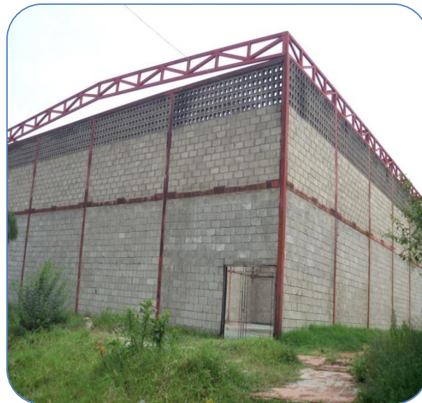
Cancha Deportiva Antonio María Portes. (2012).