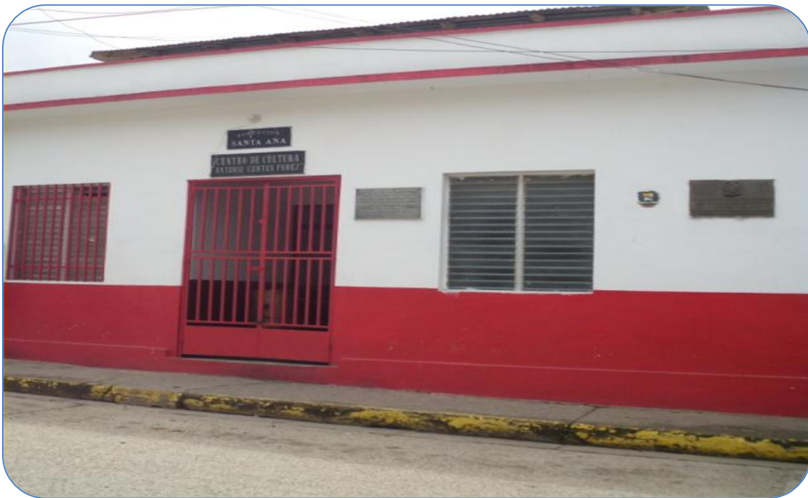
Foto: Investigadores. Casa de la Cultura Antonio Cortes Pérez (2012). Antonio Pérez Materan.