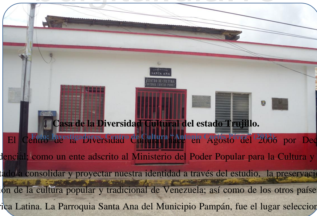
Casa de la Diversidad Cultural del estado Trujillo.