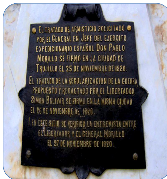
Foto: Investigadores. Placa ubicada en la Plaza de Armisticio (2012).

El fue firmado en Trujillo el 25 de Noviembre en la noche y el 26, el de Regularización de la Guerra; Mediante este acuerdo ambos bandos se comprometían a hacer la guerra "como lo hacen los pueblos civilizados", acordando el respeto a los no combatientes, el canje de prisioneros y a acabar definitivamente con las viejas prácticas de la guerra a muerte. Este representa el principal antecedente del