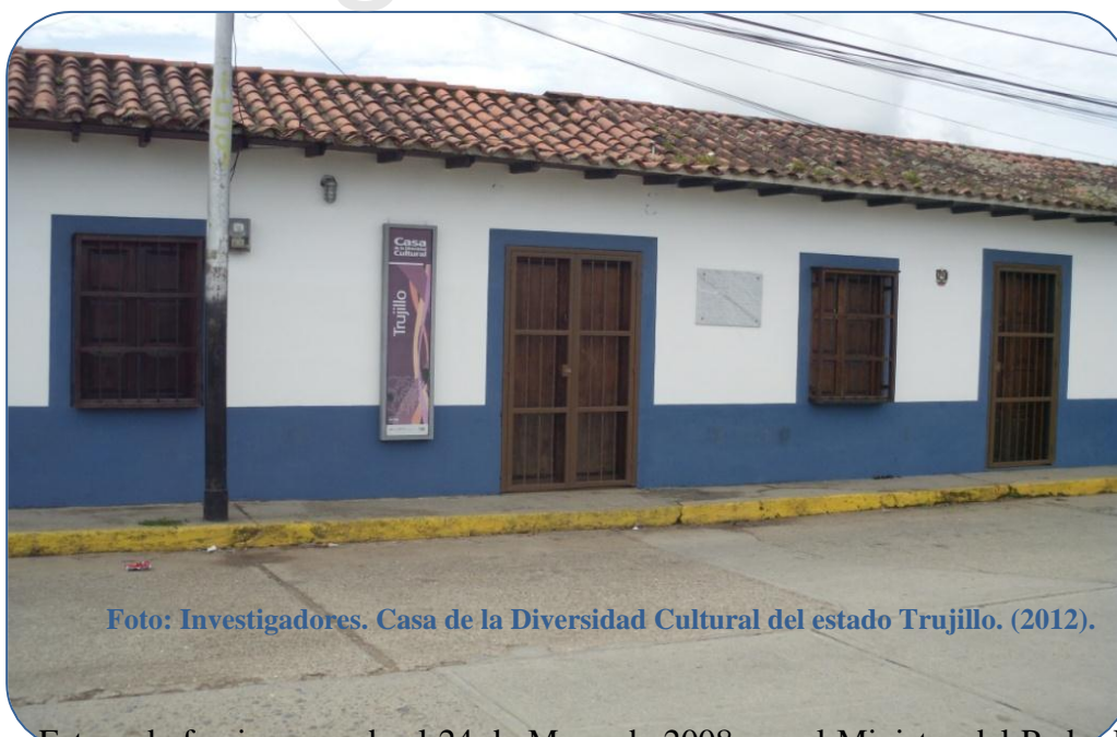
Foto: Investigadores. Casa de la Diversidad Cultural del estado Trujillo. (2012).

Esta sede fue inaugurada el 24 de Mayo de 2008 por el Ministro del Poder Popular de la Cultura Francisco Farruco Sesto, como un ente adscrito a la Fundación Centro de la