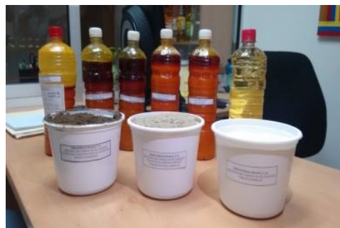
Figura 1: Muestras de aceite crudo de palma y arcillas de blanqueo antes y después del blanqueo de aceite.

impurezas remanentes del aceite adquieren un color marrón oscuro y se tornan altamente inflamables por el contenido graso que se incorpora en la superficie. Estos materiales retienen alrededor de un 30 % p/p de aceite y sus impurezas.