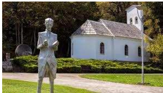
Figura 2: Museo e iglesia serbia ortodoxa en memoria de Nikola Tesla [17].

Su padre Milutin Tesla (1819-1879) era un sacerdote serbio de la iglesia ortodoxa. Su madre Georgina Đuka Tesla (1822-1892) era ama de casa y Nikola siempre afirmó que su genio e inventiva se lo debía a ella, ya que ideó varios