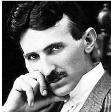
Figura 1: Nikola Tesla a sus 34 años de edad [16].

Nikola Tesla (Figura 1) nace en Smiljan (actualmente Croacia) el 9 de julio de 1856 [14], que en ese momento era parte del Imperio Austro-Húngaro, ubicada en Gospić, condado de Lika-Senj. Aún hay autores que referencian como fecha de nacimiento el día 10 de julio de ese mismo año [15]. Esta pequeña localidad, en el año de 1857 superaba los 2.000 habitantes; sin embargo, para el último censo del año 2011, se ha visto un descenso en su población llegando a alcanzar apenas los 420 habitantes. Actualmente, la casa de Nikola Tesla y otras edificaciones son un memorial a su vida e inventos (Figura 2).