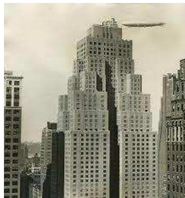
Figura 4: Hotel New Yorker [19].

En 1882 comienza a trabajar en la Continental Edison Company en París. En 1884, viaja en transatlántico a New York y comienza a trabajar con Thomas Alva Edison, gracias a una carta de recomendación. Son innumerables sus inventos, pasa años trabajando en un sistema diseñado para transmitir de forma inalámbrica voces, imágenes fijas y en movimiento y energía eléctrica convirtiéndolo en un futurista y el verdadero padre de la radio, el teléfono, los teléfonos celulares, la televisión y los sistemas eléctricos de potencia. Muere solo y, prácticamente como un indigente el 7 de Enero de 1943, a sus 86 años de edad, en un cuarto del Hotel New Yorker, ver Figura 4.