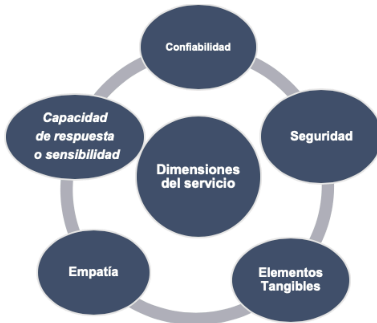
Figura 1 Dimensiones del servicio