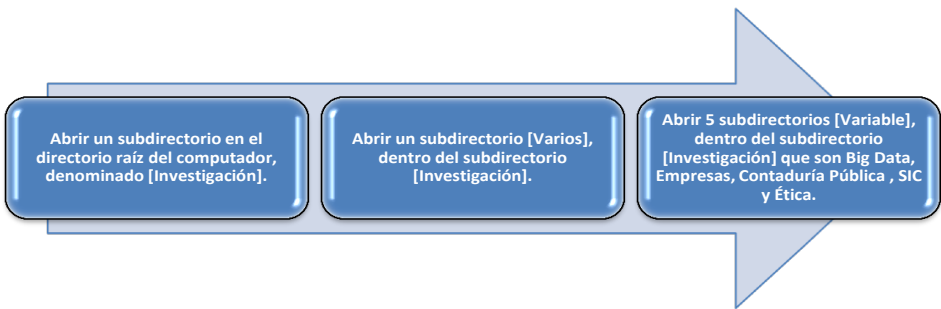
Gráfico 1. Procedimiento de apertura de los directorios necesarios para almacenar documentos.

Los datos cualitativos obtenidos de los autores, deben ser agrupados de acuerdo con cada variable que son: Big Data , Contadores Públicos, Empresas, SIC y Ética, para realizar el análisis crítico y de interpretación y poder contar con criterios que en conjunto forman parte de los resultados y conclusiones que serán discutidos en esta investigación. Véanse las figuras 1, 2 y 3, que forman parte del modelo de herramientas utilizadas para la captura de los datos cualitativos. Los sitios de donde se recuperan los artículos, se utilizan para los datos de las referencias bibliográficas.