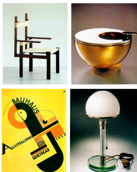
Figura 1. Diseños icónicos de la Bauhaus del período de Weimar: Silla Lattenstuhl de Marcel Breuer, cenicero de Marianne Brandt, diseño gráfico de Joost Schmidt y lámpara de mesa MT9 por Wilhelm Wagenfeld.