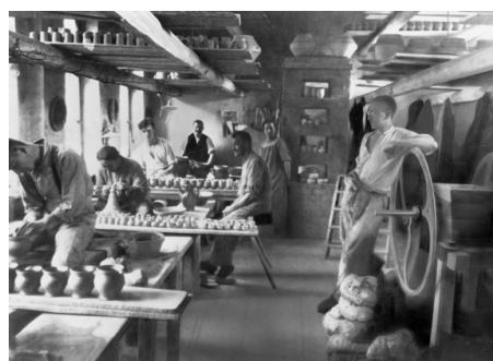
Figura 5. Taller de alfarería de la Bauhaus de Weimar ubicado en Dornburg, circa 1924. Claro ejemplo de la implementación del modelo británico de enseñanza de taller, con las modificaciones del caso.

parte de este cargo, se centró en reformar la educación de las artes aplicadas dándole gran énfasis a la instrucción en talleres de prototipos, con la asistencia de figuras clave del diseño alemán como los arquitectos Peter Behrens, Hans Poelzig y Bruno Paul, quienes fueron designados como directores de algunas de las más importantes instituciones educativas en la materia (Woodham, 1977, p. 19). Sin embargo, la fuerte dependencia alemana en el sistema de aprendices-empleados antes de la Primera Guerra Mundial (Beckwith, 1913, p. 65), frenó dichas instituciones para ofrecer el último tipo de enseñanza de taller desarrollado en la Gran Bretaña. De hecho, la mayoría del aprendizaje de taller se seguía dando en los lugares de trabajo de los aprendices, recibiendo solo una educación complementaria de taller en las escuelas de artes aplicadas ( Kunstgewerbliche Schulen ), cuyas instalaciones rara vez contaban con todas las áreas de taller y equipos requeridos para la entera educación de cada oficio (Beckwith, 1913, p. 100). En este sentido, los talleres de prototipos de la Bauhaus de Weimar fueron entre los primeros de Alemania en seguir de cerca el último modelo de enseñanza en el taller derivado del Arts and Crafts británico, con la adición innovadora de ser dictados tanto por un maestro artesano como por un maestro de la forma (un artista), en lugar de sólo ser dictado por el primero –ver figura 5–.