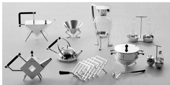
Figura 4. Diseños de Christopher Dresser, según reproducciones históricas hechas por la compañía italiana Alessi en 1991.

cocés Christopher Dresser (1834-1904). Este se había educado en la escuela gubernamental de diseño de Londres, donde después enseñó botánica aplicada a las artes por catorce años (Fiell & Fiell, 1999, p. 220). Para Dresser el diseño era más una disciplina objetiva que un arte inspirador (Naylor, 1992, p. 239). A tal punto, que sus análisis de la geometría y de los principios estructurales de las formas naturales lo llevaron a rechazar la representación imitativa y las soluciones estilísticas (Heskett, 1980, p. 25). De hecho, durante las décadas 1870 y 1880, ésta aproximación lo condujo a escribir sus Principles of Decorative Design de 1873, así como a producir diseños bastante originales, donde la abstracción estética, la funcionalidad y la facilidad de manufactura son apropiadamente combinadas (Dresser, 1973) -figura 4-.