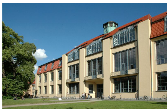
Figura 2. Edificio de Van de Velde para la Escuela de Artes Aplicadas de Weimar, luego sede de la Bauhaus de Weimar.

y seguidor del Movimiento del Arte Infantil de 1890, Franz Cižek (1865-1946), también desarrolló principios de enseñanza innovadores (Wingler, 1975, p. 9). Desafortunadamente, el inicio de la Primera Guerra Mundial hace que Van de Velde renuncie en 1915 y la escuela cierre, para ser posteriormente re-abierta por Gropius como la Staatliches Bauhaus en abril de 1919.