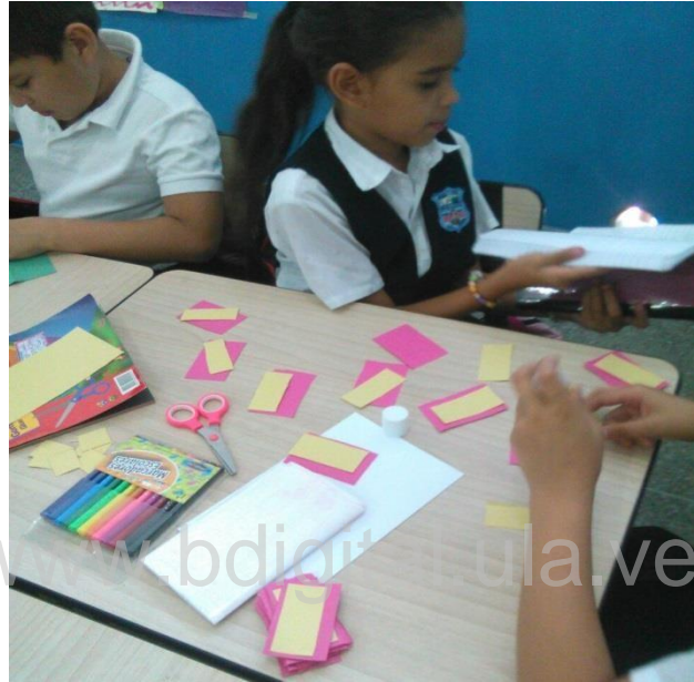
Imagen 3: Estudiantes construyendo el juego de memoria

material solicitado por la docente para la elaboración del mismo, luego cada uno de los miembros tuvo su turno para jugar, luego de este juego, la docente hizo un dictado corto describiendo a una persona, los estudiantes usaron las palabras oídas y sus tarjetas para armar en forma ordenada el dictado como lo escucharon.