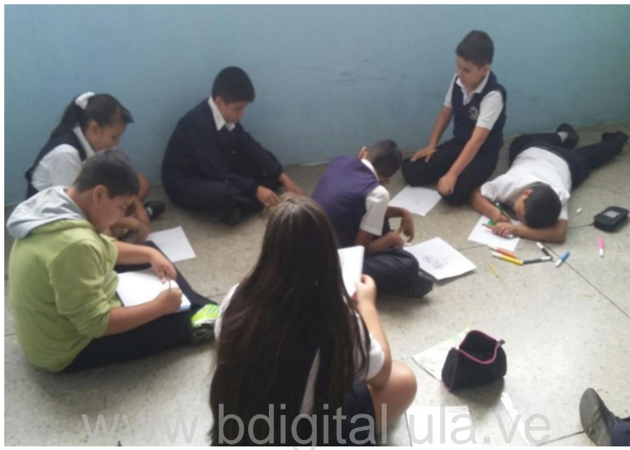
Imagen 2: Estudiantes trabajando en la historia “my day”

“My Day”, el collage más original gana un premio. Ésta premiación se llevará a cabo por un proceso de autoevaluación y evaluación.