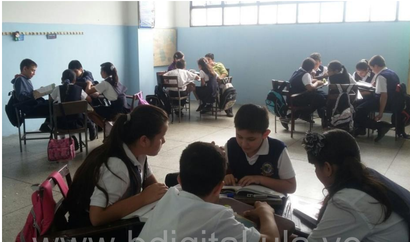
Imagen 1: Grupo de estudiantes creando las oraciones

para que en grupo construyeran oraciones en presente simple siguiendo el correcto orden gramatical. Se evidenció en los registros escritos la transformación del grupo, en todos los aspectos tanto en el compromiso en hacer la actividad, la responsabilidad, hasta en cumplir con la disciplina.