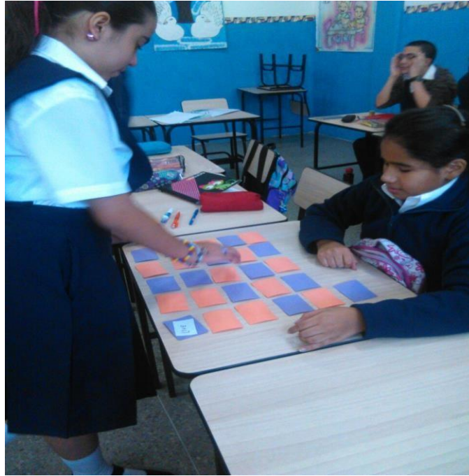
Imagen 4: Estudiantes jugando