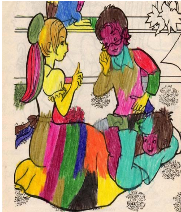
Muestra de un dibujo coloreado de una participante.

Se pudo observar que tomaban el lápiz incorrectamente, coloreaban sin límites, no tenían conocimiento de derecha e izquierda, arriba – abajo. Los colores no estaban sujetos a la realidad, mezclaban colores desordenadamente, no realizaron ninguna producción de los cuentos leídos sólo se observó el disfrute de escucharlos.