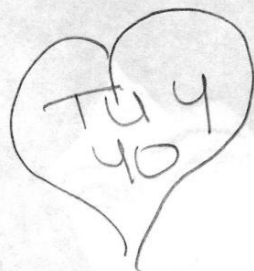
Muestra: Producción escrita de una de las participantes.

Los 2 nos quisimos mucho. Y en todas partes a las que fuamos escribiamos: