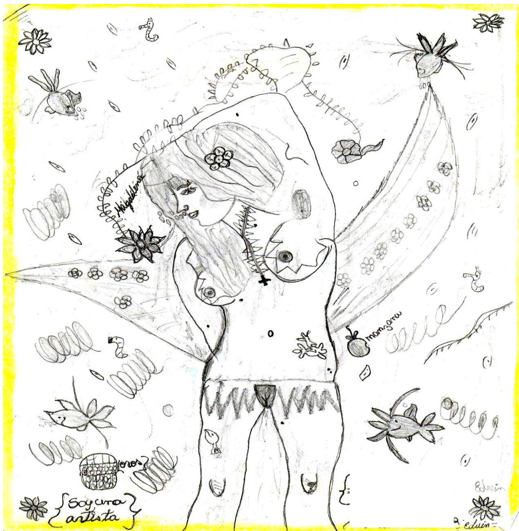
Muestra: Dibujo realizado por una adolescente.

A través de este tipo de actividad se logró el contacto con la palabra escrita y la lectura con significado, contribuyendo al pensamiento libre para el desarrollo de expresión creativa. Durante la actividad se relacionó las experiencias de la lectura y emociones vividas en cada una, en todo momento se respetaron las expresiones espontáneas de las participantes, compartiendo entre ellas experiencias y