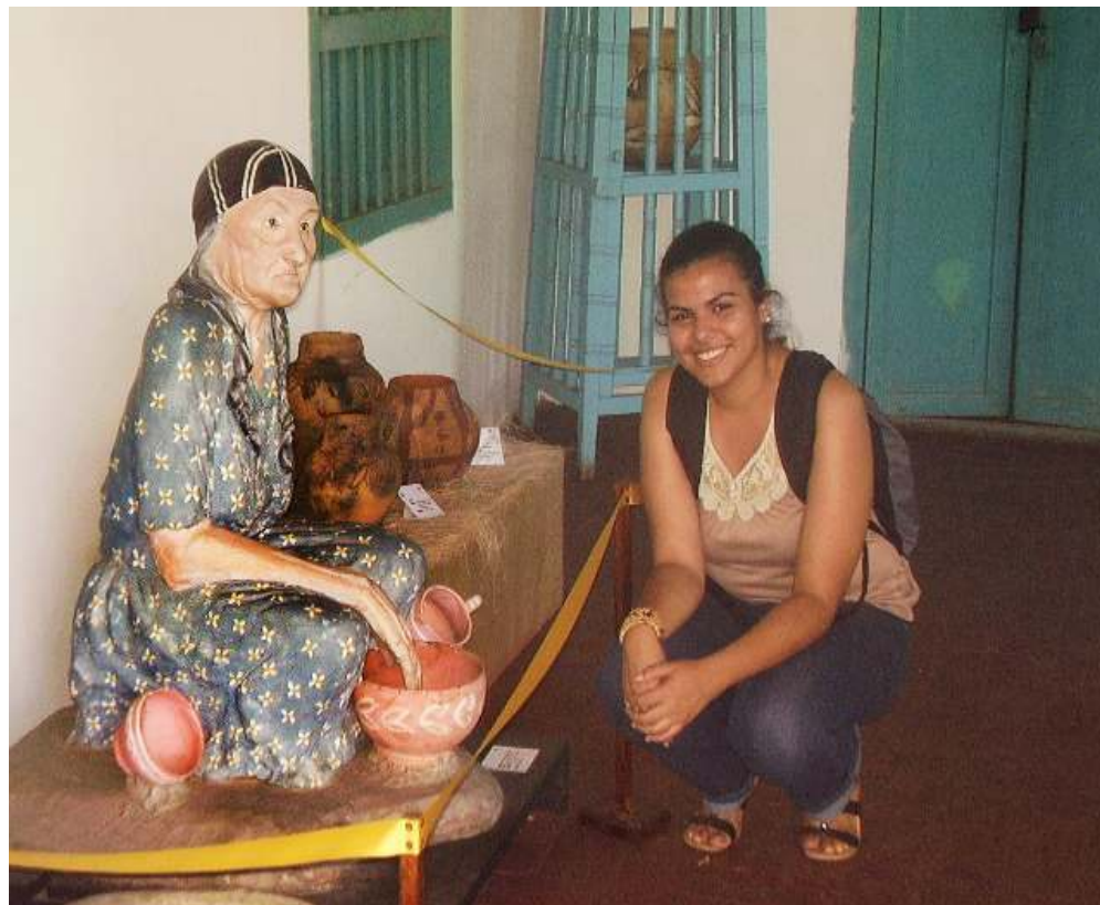
Primera visita a Coro.

Con este preámbulo de ideas que ponen en evidencia algunos aspectos de mi lugar enunciativo como investigadora, proseguiré a presentar un conjunto de vivencias del trabajo etnográfico realizado, particularmente, algunas pinceladas de sensorialidad en la conexión humana de cada casa patrimonial abordada y formalmente sistematizada como entrevista.