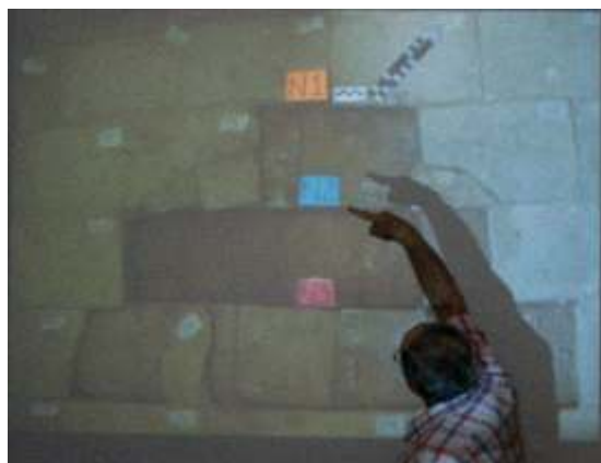
Imágenes sobre Hallazgo del Mikvé, conferencia por el Antrop. Carlos Martín.

La conferencia desató al admiración de muchos. Luego vino la visita a la casa, cuya fachada en primera instancia fue el gris brillante de las latas de zinc que temporalmente cercaban la casa. La llave maestra para conocer el territorio de los tesoros judíos fue el la presencia del Viceministro de la Cultura, ya que la casa, cotidianamente se encontraba cerrada por los trabajos de restauración e investigaciones posteriores al hallazgo de diversos elementos de interés arqueológico. Luego de este evento, continuaron las expediciones “tras la fachada”.