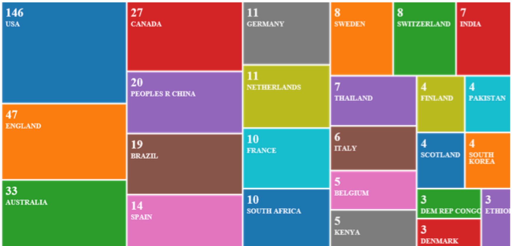
Tabla 5 Publicaciones respecto a regiones y países

Fuente: Elaboración propia a partir de Clarivate Analytics (Web of Science)