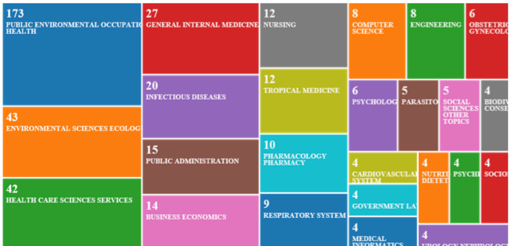
Tabla 3 Áreas de Investigación