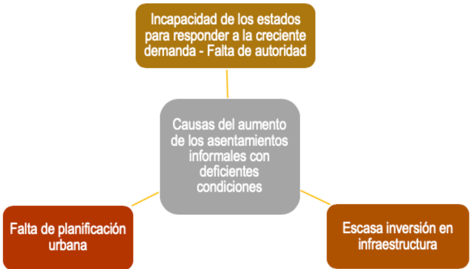
Figura 1 Causas del aumento de los asentamientos informales.

Elaboración propia basándose en la información recuperada y disponible en los siguientes documentos y/o enlaces: http://repositorio.cepal.org/bitstream/handle/11362/37649/S1421065_es.pdf?sequence=1 Urbanización y políticas de Vivienda en China y América Latina y el Caribe, perspectiva y análisis de casos; libro "Un espacio para el desarrollo: Los mercados de vivienda en América Latina y el Caribe", editado por César Patricio Bouillon, Banco Interamericano de Desarrollo (2013).