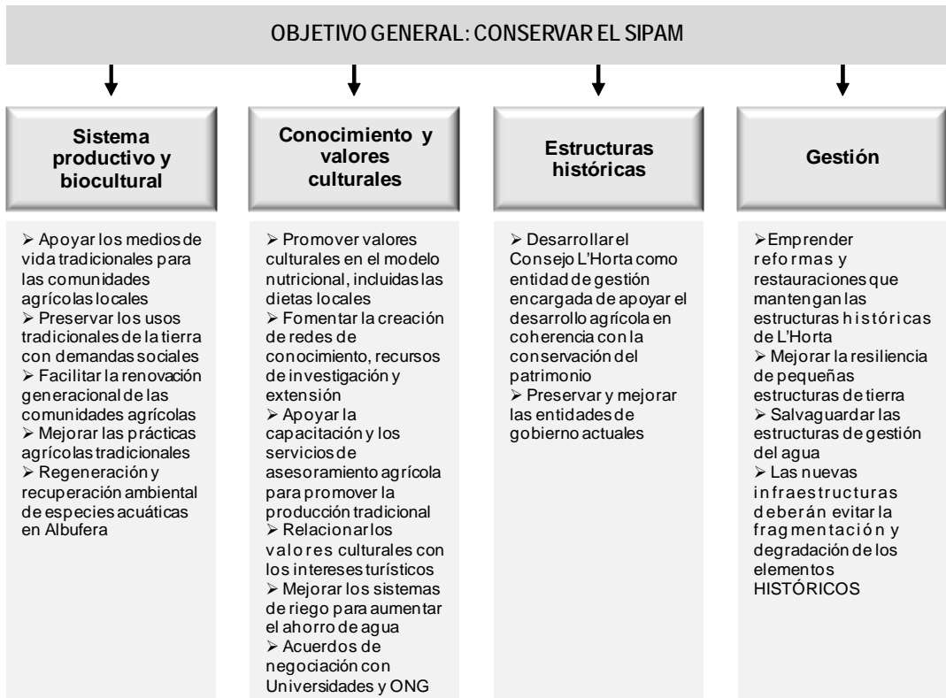
Figura 2. Plan de acción del SIPAM.